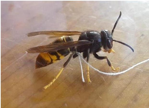
Caractéristiques du frelon asiatique : thorax noir, extrémités des pattes jaunes

Introduit accidentellement près de Bordeaux, le frelon asiatique a colonisé plus de 80 % du territoire français en 15 ans. Les premiers nids ont été découverts dans le Tournaisis, mais la progression est rapide en Wallonie.